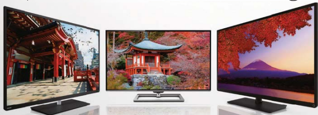
➤ Série L4

➤ La touche japonaise qui donne la priorité à votre budget.